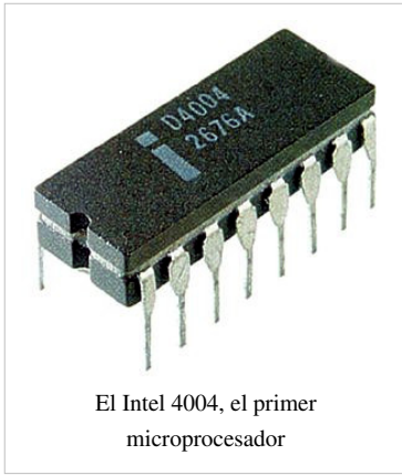
El Intel 4004, el primer microprocesador

Después de la introducción en 1972 del Intel 4004, los costos de los microprocesadores declinaron rápidamente. En 1974 la revista de electrónica estadounidense Radio-Electronics describió el kit de computadora Mark-8, basado en el procesador Intel 8008. En enero del siguiente año, la revista Popular Electronics publicó un artículo que describía un kit basado en el Intel 8080, un procesador algo más potente y más fácil de usar. El Altair 8800 se vendió extraordinariamente bien, aunque el tamaño de la memoria inicial estaba limitado a unos pocos cientos de bytes y no había software disponible. Sin embargo, el kit del Altair era mucho menos costoso que un sistema de desarrollo de Intel de ese tiempo, así que fue comprado por compañías interesadas en desarrollar un control de microprocesador para sus propios productos. Tarjetas de expansión de memoria y periféricos fueron pronto